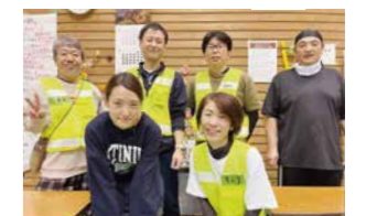
後列左から2番目が多賀部長