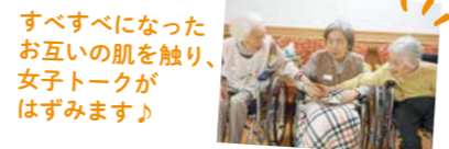
すべすべになったお互いの肌を触り、女子トークがはずみず♪