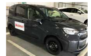
DWAT(災害派遣福祉チーム)の車で4日間巡回