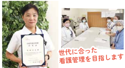
世代に合った看護管理を目指します！

認定看護管理者とは、管理者として優れた資質を持ち、創造的に組織を発展させることができる能力を有すると日本看護協会に認定された看護師のこと。長く管理職を続ける中で、広い視野での看護管理や経営・マネジメントに関する学びの必要性を感じ、認定看護管理者研修サードレベルを受講、見事合格しました。