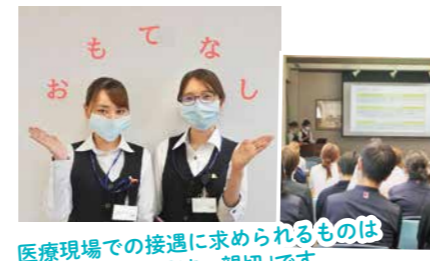
医療現場での接遇に求められるものは「丁寧・正確・迅速・親切」です

東京でマンツーマンの接遇研修を受講してきた、当院の医療クラークが講師となり、接遇研修を開催。おもてなしの心を持って相手に接する「接遇の基本」を振り返りました。