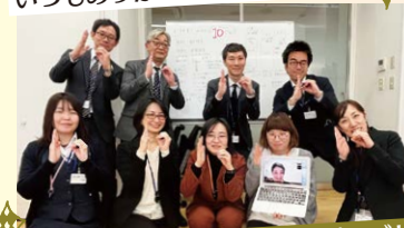
編集会議後に「10」ポーズ!