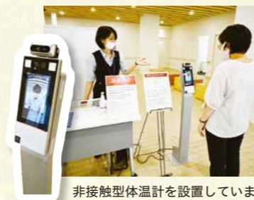
非接触型体温計を設置しています

患者さん、利用者さん、付き添いの方、職員、取引業者全ての方に対して、マスク着用、検温、消毒を徹底して行います。