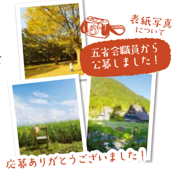
応募ありがとうございました!

担当医は都合により変更になる場合があります。ホームページ上の「外来診療スケジュール」にて休診・代診などの情報をご確認ください。