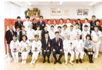
西能病院・西能クリニック職員