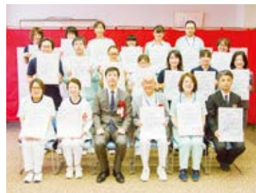
西能みなみ病院・みどり苑職員