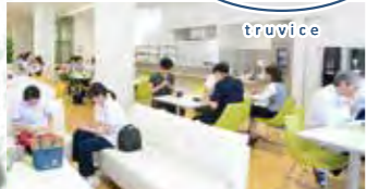
他部署のスタッフと交流のひとつ