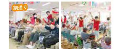
綱送り お揃いのハチマキで力を合わせて...!

今年も恒例「みどり苑大運動会」を開催しました。通所・入所・ショートステイご利用の皆さんが紅白チームに分かれ対戦。綱送り、借り物競争、玉入れなどの競技で熱戦が繰り広げられました。皆さん笑顔で楽しんでいらっしゃる姿がとても印象的でした。