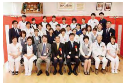
西能病院・西能クリニック職員