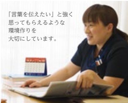
「言葉を伝えたい」と強く思ってもらえるような環境作りを大切にしています。

第3弾は、作業療法士、理学療法士と並んで国家資格を有するリハビリの専門家「言語聴覚士」を紹介いたします。さまざまな理由により、「話す」「食べる」といった面に不自由さを抱えている人をサポートする大切な仕事です。五省会で活躍する4名の言語聴覚士を訪ねました。