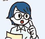
田近 美由紀 臨床検査技師