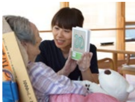
今まで伝えられなかった思いが家族に届いた時の喜びや感動は、大きなやりがいになります。

うまく言葉が話せない・声が出せない等、コミュニケーションに障害がある方に対して、言葉のリハビリを行います。障害の原因は一人ひとり異なるので、患者さんに適した訓練法を探ります。