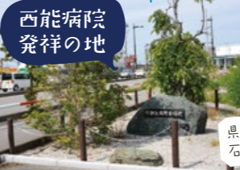
西能病院 発祥の地 県道沿いに石碑が建てられています!