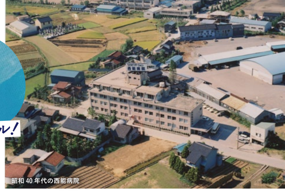
昭和40年代の西能病院