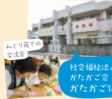
みどり苑での交流会 社会福祉法人かたかご会 かたかご保育園

看護の質の向上、働く看護職の環境改善、在宅医療の充実に向けて取り組んでいます。現在は特に、夜勤の負担軽減、離職してブランクがある方への再就職支援、訪問看護等の体制づくりに力を入れています。看護の現場のニーズにあわせて看護師の教育研修も年間80回開催。さらに高度な看護が実践できるよう認定看護師の養成も行っています。