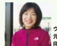
ウルトラ100kmマラソン 元日本代表 田中 寿美子氏

■7.13(木) “笑顔で”フルマラソンを完走しよう! ランニングフォーム講座 富山県総合運動公園・陸上競技場