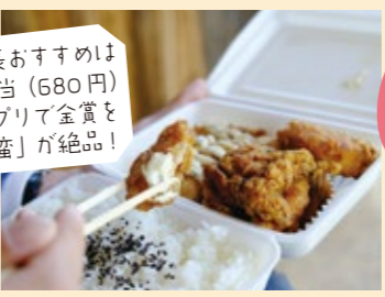
とりしょう 鶏笑 富山五福店

理事長おすすめはMIX弁当(680円)からあげグランプリで金賞を受賞した「チキン南蛮」が絶品!