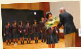
高岡商業高校陸上部のみなさんも聴講しました！

プロフィール 1941年生まれ 出身地：福岡県 1959年 八幡製鐵(現新日本製鐵)入社 1964年 東京五輪マラソン 8位 1966年 ポストマラソン大会 優勝 1968年 メキシコ五輪マラソン 銀メダル 1972年 ミュンヘン五輪マラソン 5位以降、70回以上マラソン大会に出場し途中棄権せず完走し続けており、50年前に優勝したポストマラソンに、今年は招待選手として挑戦されます。