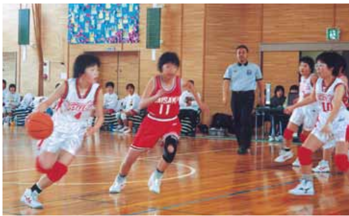
小学校6年生のときの写真(左)

そんなことから、専門学校は選手の健康管理やスポーツ障害の予防を学ぶ「トライデントスポーツ科」に入りました。現在リハビリテーション科で事務をしていますが、スポーツ障害で通う若い患者さんの気持ちに痛みほどよくわかるので、少しでも寄りそって、回復へのサポートをしたいと思う日々です。