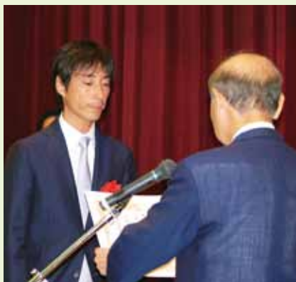
西能理事長が石川県知事から表彰状を頂きました

去る8月31日、高志会館において富山県主催 平成24年度「元氣とやま！仕事と子育て両立支援企業表彰」が開催され、当法人が優良企業として表彰されました。五