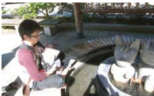
足湯のあまりの熱さにおののく父と泣きまくる娘 (瀬波温泉にて)