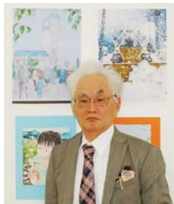
作品(水彩画)を背に、春色のネクタイで

看護師が「おっ！」と驚く病院の床よたよたと三歩あゆめば 嗚呼、五月、四方八方山躑躅一つまんで蜜吸ひてみる