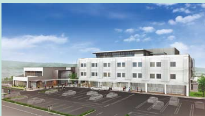
整形外科センター西能クリニック(左)と西能病院(右)

以上のように病院と診療所が担う機能を明確に分け、高度な手術機能と快適な療養環境を有する入院部門と、地域に開かれた診療をおこなう外来部門とが一体となって、富山地域の整形外科医療のセンターとして機能する医療施設を目指す計画です。