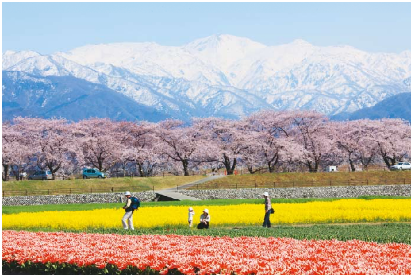
舟川の春（朝日町）