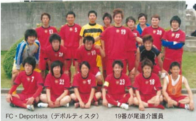
FC・Deportista（デポルティスタ） 19番が尾道介護員

ルしか存在せず、試合を行うにあたっての最低限の規則しか設けられていません。そのなかには、「サッカーをするすべての仲間を大切に、協力し助け合う」ことの重要性が説かれているのだと、今になってわかりました。サッカーという団体スポーツを通して、単に「勝つ」ということだけにこだわらず、仲間との関わりの中で自身が成長し、リフレッシュにつながれば、これ以上の幸せはありません。