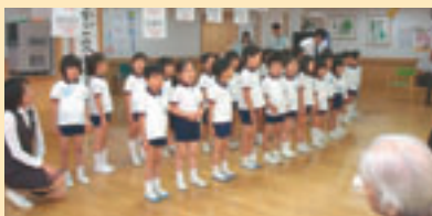
みどり苑では、毎月かたかご保育園の園児さんと交流会を開いています。