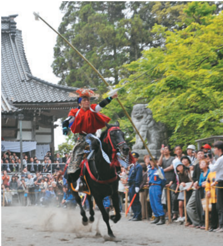
的を射る