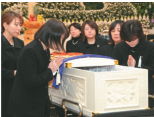
別離を惜しむ職員

昨年四月、五省会の事業承継を見据えて法人本部が組織され、医療部門においては私が西能病院の院長に就任しました。