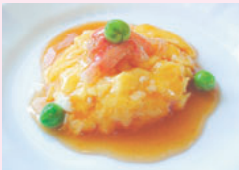
カニ玉ボール：嚥下食とは素材を軟らかく煮たり、すりおろしたものをゼラチンや卵や芋類で固めたり、片栗粉でトロミをつけたもの

食べ物にトロミをつける方法があります。刻んだ食べ物にトロミを付けたり、出し汁やスープをかけた後、お茶やジュースにトロミを付けたりします。トロミの素は介護用品を扱うお店に売られており、簡単に使用することができます。 また、食べ物をミキサーにかけた後、ゼラチンや寒天で固めると喉ごしが良くなります。トロミの濃度や固める硬さは飲み込む力によるので、専門家に確認しましょう。