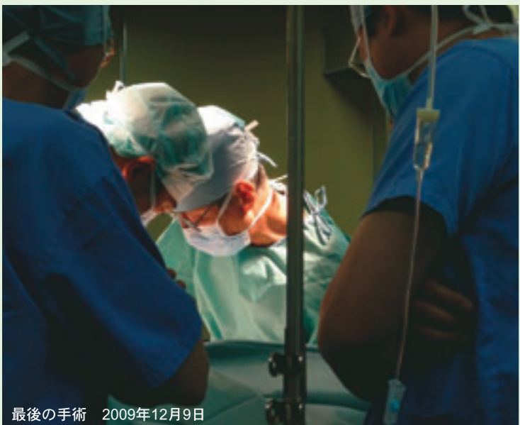
最後の手術 2009年12月9日