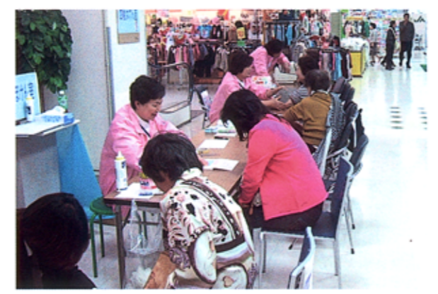
▲「看護の日」(5月12日ナイチンゲールの誕生日)には、各施設の看護師が協力して「西能ほけん室」を開催しています。

2 看護の立場から患者満足度の向上をはかる 看護部では、病棟や外来の環境整備を目的に「院内ラウンド」を行っています。 3 施設における看護職員交流を円滑に進めるとともに、職場満足度を高める 西能病院、西能みなみ病院、みどり苑の五省会3施設間の業務連携を円滑に行うために、看護部では施設間の看護職員の連携や交流を積極的に進めています。また、職員ができるだけ希望の職場で勤務できるように配慮し、必要時には施設間の人事異動も行っていきます。さらに合同研修会やケースカンファレンスの実施など、施設間で情報を共有する取り組みも進めていく予定です。 4 医療安全管理体制の充実(医療安全と感染防止) 医療安全と感染防止の徹底は、病院にとっての重要な課題です。当院では、医師、看護師をはじめとする他職種がメンバーとなり「医療安全委員会」「感染防止委員会」を組織しています。毎月委員が院内を巡回して事故