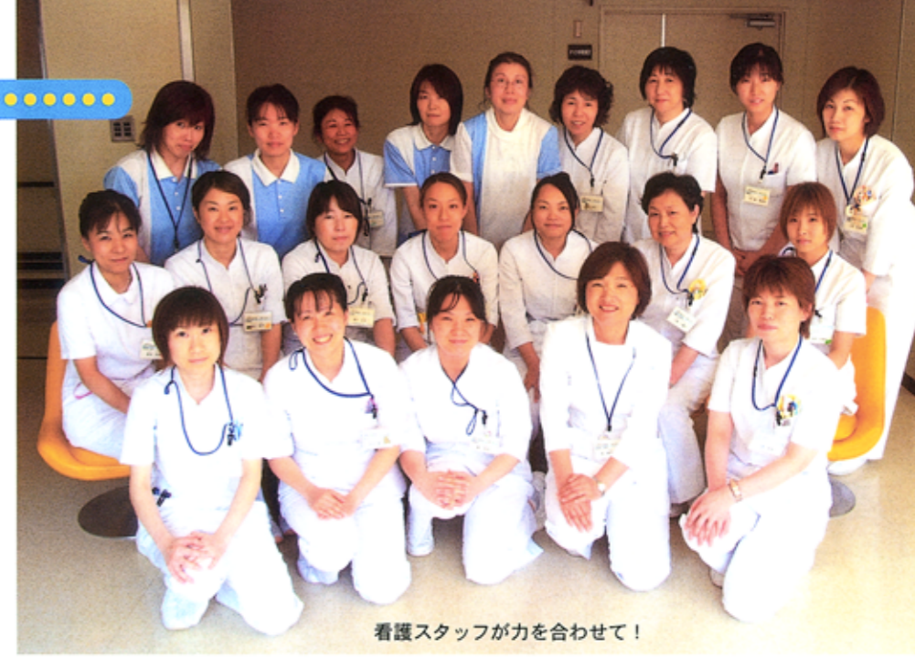
看護スタッフが力を合わせて!

西能病院看護部では、今年度の業務・活動を通して以下の5つの目標を掲げています。これらを達成するため、部署単位で月間目標を立てて業務に取り組んでいる他、看護師一人ひとりが個人目標を立てて自己評価を行うなど、業務改善(=部署)と資質向上(=個人)の両面からレベルアップに努めています。 “安心と信頼”、さらに“満足”を感じていただける看護を目指し、患者様の声に耳を傾けながら、明るく安全な病院環境づくりに取り組んでいきます。