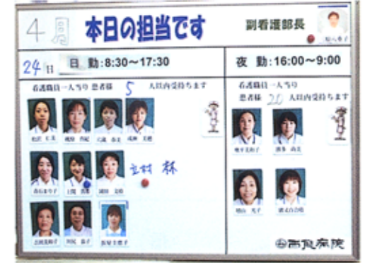
▲各病棟のナースセンターには、その日の担当看護師の写真を貼ったボードがあります。