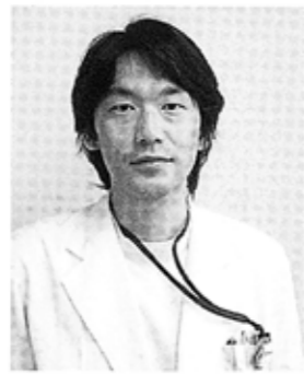
「患者様の声に耳を傾け、信頼していただけるよう努めます」

〔略歴〕 平成2年 富山医科薬科大学卒 ／第一外科入局 竹田総合病院、社会保険高岡病院、富山赤十字病院、国立療養所富山病院、新潟県立妙高病院、糸魚川医療生活協同組合姫川病院等で勤務 日本外科学会会員 〔得意分野〕 消化器疾患