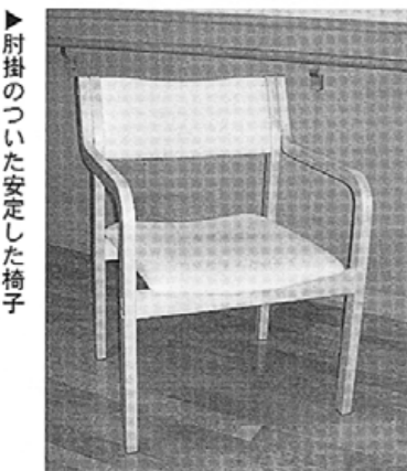
▶肘掛のついた安定した椅子

前回、環境づくりの中でも住居の面でのアドバイスをしましたが、今回は住居の中で使用できる用具について説明します。