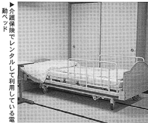
▶介護保険でレンタルして利用している電動ベッド

【用具】 これまででは布団やコタツを利用して立っていたけど、床からの立ち上がりが困難になってし