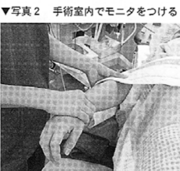
写真2 手術室内でモニタをつける