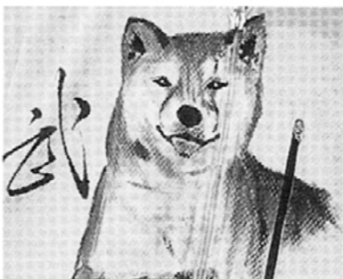
ベストに描かれた愛犬の絵