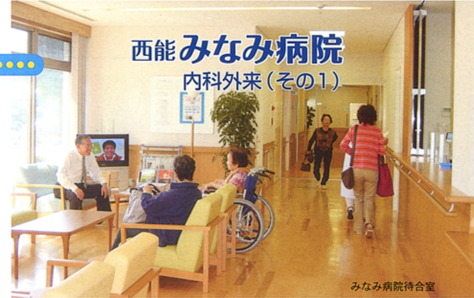
みなみ病院待合室