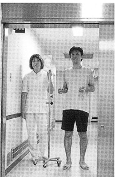
写真1 手術室へ歩行入室