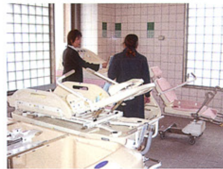
⑥3階浴室 最新機器で、気持ちよく入浴していただけます