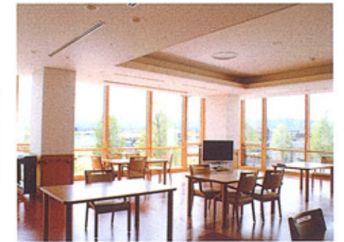
②食堂・談話室 大きな窓から立山連峰が一望でき、ゆったりとすごしていただけます