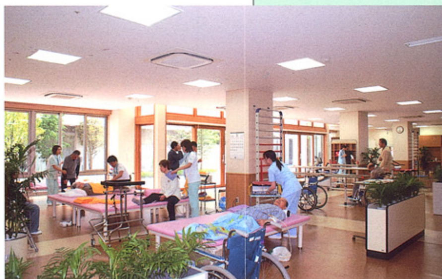
⑨リハビリ訓練室 広い運動スペースと最新の医療技術で、機能回復訓練を行います