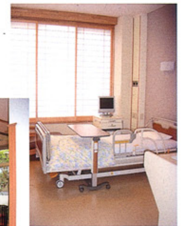
④病室（個室） 木材を多用し、障子を透ったやわらかい光に家庭的なぬくもりが感じられます