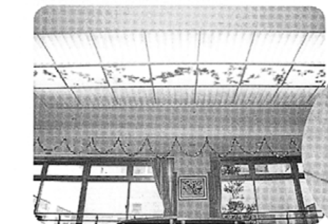
2・3階の食堂天井には埋め込み式でHF蛍光灯32Wが72本が設置されています