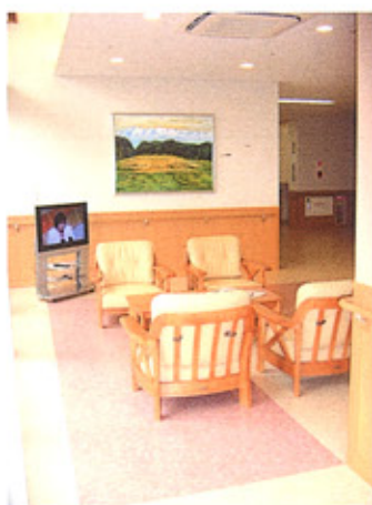
⑧サンルーム 明るい、くつろぎと交流の空間です