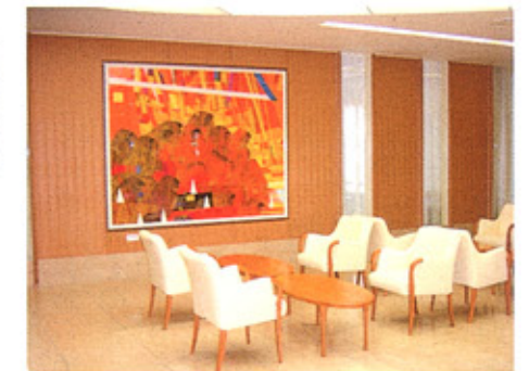
③玄関ホール 林清納画伯の大作「大地」がご来院のみなさまをお迎えます