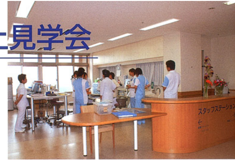
①スタッフステーション オープンなつくりで、患者様とのコミュニケーションを大切にします

富山市秋ヶ島、みどり苑北側に西能みなみ病院が開院しました。鉄筋コンクリート3階建て、延べ床面積4354平方メートルで、2・3階は広い廊下の両側に88床の病室が並んでいます。在宅復帰を目的とする医療療養型病院として、リハビリ訓練室や食堂・サンルームはゆったりとしたスペースをとり、自然豊かな環境を楽しめるようになっています。