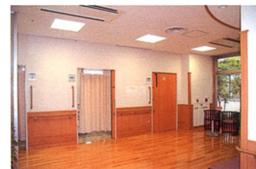
⑤診療室・ロビー ゆったりした空間で、診療を待っていただけます