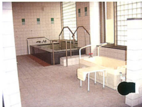
⑦2階浴室 患者様の容態に合わせた多様なバスを整えました