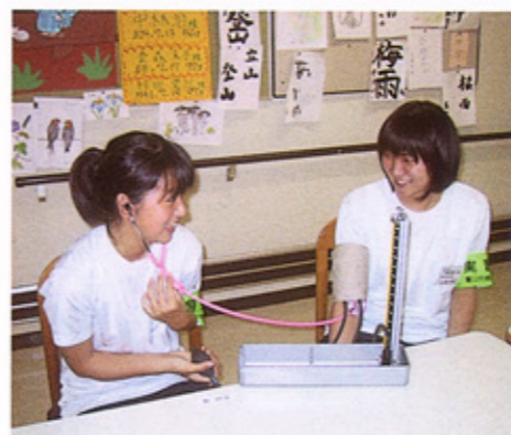
自分の健康管理も大切、血圧チェック

一人ひとりを大切に 栄養科では、管理栄養士から話を聞きました。病院厨房では安全管理のうえ、若い人から高齢者まで多様な年齢の患者様の食事を作っているが、一人ひとりの状態や好みに合わせていて、飲み込みの悪い人には...と聞いて、種類の多さとそのたいへんさを知りました。献立を作り、調理し、配膳車で各階まで運び、看護師が配膳し、食事が終わったらまた下げてと、食事ひとつ