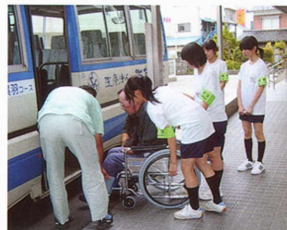
通院バスに同乗して、車イスの患者様を介助

富山県では、中学二年生全員が地域の企業や商店、社会施設などで一週間社会経験する「社会に学ぶ14歳の挑戦」が実施されています。今年度、西能病院では富山西部中学校二年生四人が体験活動を行いました。「頼まれたことを、しっかりとすぐ行動に移す」を目標に、患者様を介護したり、病院の各部門を見学してその役割を知り、病院全体が一つのチームとなって患者様の治療と看護・介護に当たっていることを学びました。