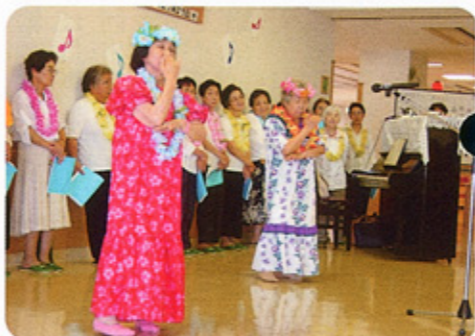
フラダンスを踊る楽しく歌おう会のお二人