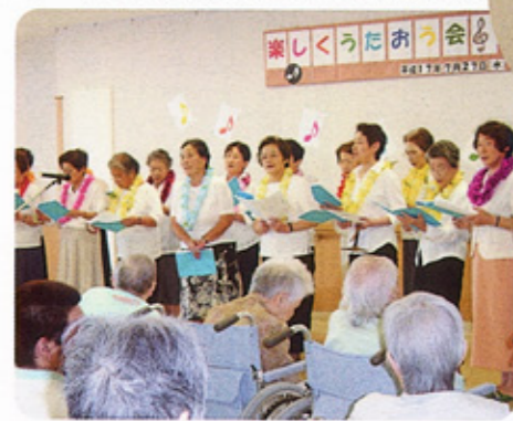
色とりどりのレイを掛けて歌うメンバー

年齢差がありながら、同級生のように仲のよい会です。元氣そうに見える力もメンバーそれぞれ加齢による体の衰えや障がいがあり、大きな声を出して歌うことがリハビリにもなっています。「苑のみなさんは、先輩。いっしょに歌って、元氣をもらいました。来年も呼んでください」と、