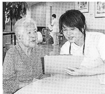
利用者さまから食習慣や好みを聞いて食事療養に生かしています

務を委託している会社のスタッフと協力して、手洗い消毒から食品の温度管理、清掃にいたるまでマニュアルを作成し、遵守することで食中毒や異物混入の防止に努めています。 これらの目標はどれも管理栄養士ひとりの力で達成できるものではありません。職員全員が協力し、よりよい食事で利用者様の健康を維持し、自立を支援するという使命感をもって働きたいと思っています。 (栄養管理室 坂井亜紀)