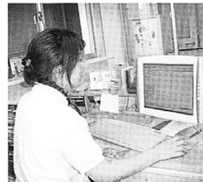
パソコンで全体を把握しながら栄養管理に関する連携を行っています

みどり苑には、栄養管理室が設けられ、苑の食事に関して様々なことが検討、実行されています。その活動は次のとおりです。 〈目標1〉苑での生活を豊かで潤いのあるものとし、精神的安定を図る―季節を感じられる献立や家庭で馴染み深い料理のほかに、美味しい食事を楽しく食べていただくために、イベントメニューでは嗅覚や視覚・聴覚など五感を刺激する食事を心がけています。 〈目標2〉適切な栄養管理により食事療養を行う―咀嚼や嚥下機能の低下、体調不良、認知症、廃用症候群など多種多様な高齢者の低栄養を全職種が協力して解決するために、平成十六年二月に栄養サポートチームを設立、活動を行っています。 〈目標3〉徹底した衛生管理のもと安全な食事を提供する―調理業