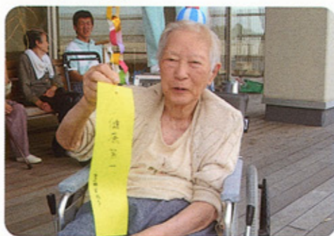
七夕の願いは、「健康第一」