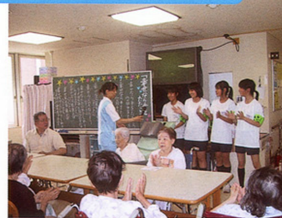
患者様といっしょに「幸せなら手をたたこう！」