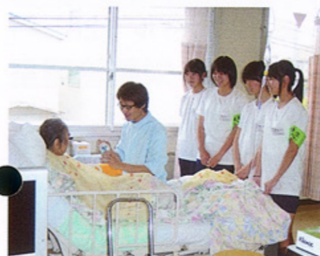
顔を見ながら、口の中に食べ物が無くなってから次のひとさじを

●患者様の気持ちになって 二階療養型病棟では、高齢の患者様の話相手になったり、身のまわりを整えたり、食事介助や車椅子の誘導をしました。また、介護職員が重度の患者様に話しかけながら食事介助をするのを見学し、介護福祉士としての仕事の大切さや介護の心構えなどを聞きました。四人は、「ありがたうといわれるのはうれしけれど、仕事は自分が疲れていてもしなければならぬから、厳しい」と知りました。「話相手がなくて、さびしそう」「思っていることを言えないの