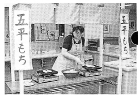
焼きたての五平餅やラーメン屋台は大好評

みどり苑には、栄養管理室が設けられ、苑の食事に関して様々なことが検討、実行されています。その活動は次のとおりです。 〈目標1〉苑での生活を豊かで潤いのあるものとし、精神的安定を図る―季節を感じられる献立や家庭で馴染み深い料理のほかに、美味しい食事を楽しく食べていただくために、イベントメニューでは嗅覚や視覚・聴覚など五感を刺激する食事を心がけています。 〈目標2〉適切な栄養管理により食事療養を行う―咀嚼や嚥下機能の低下、体調不良、認知症、廃用症候群など多種多様な高齢者の低栄養を全職種が協力して解決するために、平成十六年二月に栄養サポートチームを設立、活動を行っています。 〈目標3〉徹底した衛生管理のもと安全な食事を提供する―調理業