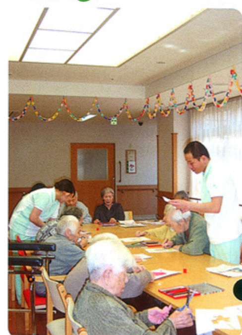
<光療法>太陽光に近い高照度光療法は、睡眠・覚醒リズムの乱れに対して有用性が高いといわれる。介護面では認知機能の改善にも有用とされ、当苑でも2階3階デイルームに設置している。