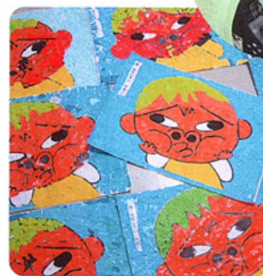
前回製作した貼り絵作品

さずに色を塗ることは注意力を養う。はさみの使い方は身につけているが、どのように切るかを指示することもある。切ったものを新しい画用紙の上と並べて形を立体構成するのだが、見本と同じようにする人もあれば、独創的な作品ができることもある。集中力が続く限られた時間だが、集団力作用で周囲の人に学んだりまたお世話しあったりと効果が上がっている。