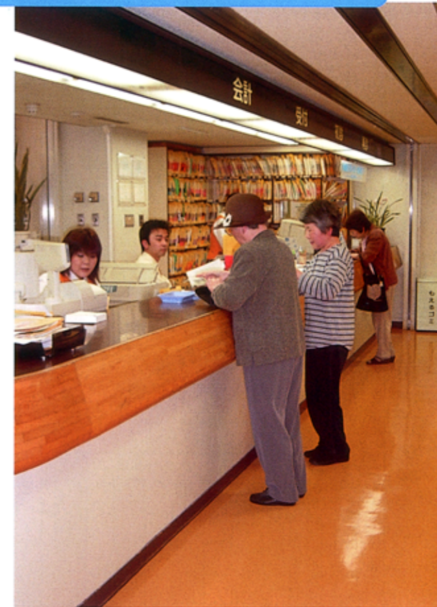
当院は個人情報の取り扱いには細心の注意を払っています。お気づきの点は窓口（受付）までお気軽にお申し出ください。