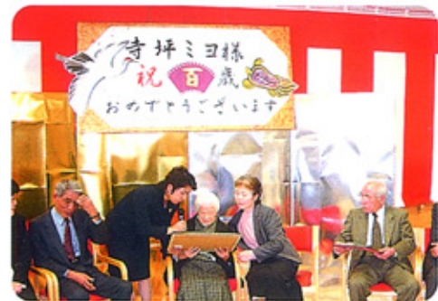
ご家族も出席のなか、お祝い行事が進められた