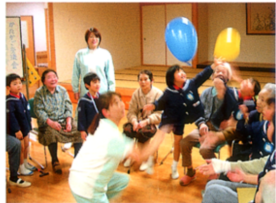
交互に並んで輪になり、2個の風船について楽しんだ

園児たちが帰り、しゅんと潮が引いたようなみどり苑では、「みんな元気で、見てるだけでも楽しいね」と柔らかな笑顔があちこちに。二階、三階の入所者のなかには、自分の孫を思い出して、「いつまでもばあちゃん子では困るけど、小さいうちが可愛いね」とおっしゃる方や、ご自身が子どもの頃を思い出して、お母さんの話をされる方もある。園児たちは家族の温かさを思い出させてくれるようだ。