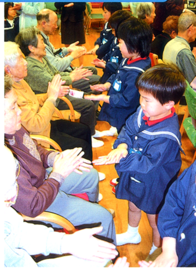
「お寺の和尚さんがカボチャの種をまきました。…」相手の手と手をたたいて、スキンシップ

っべは温かかった」などと子どもたちは実感を持った交流体験をする。「げんこつ山のためきさん：ジャンケン ポン！」とプログラムが進むにつれて、子どもたちはだんだんと本気になってきて、はしゃぎだす。おしまいの風船遊びでは、みんな輪になって風船をぼんぼんとつきあつて楽しんだ。