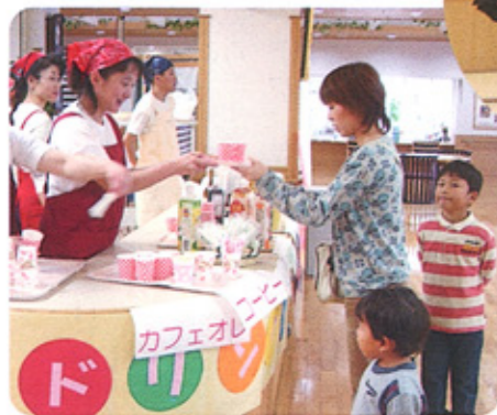
模擬店で食事を求め、親子・孫・ひ孫の四世代いっしょに食事を楽しむ風景がみられた