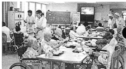
病棟をまわり、患者様のリクエストを聞いています