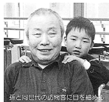
孫と同世代の訪問客に目を細める