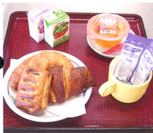
▼オベ後パン食(焼きたてパン、ゼリー、ジュースなど)

が得られるので、患者様からは好評です。 今後も、看護師と栄養科が協力し、安全においしく飲水・間食を摂っていただけるよう心がけます。