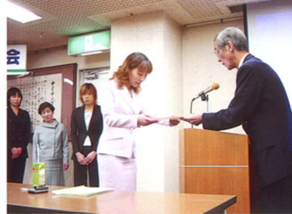
研究グループに「努力を讃える」の賞状が贈られた