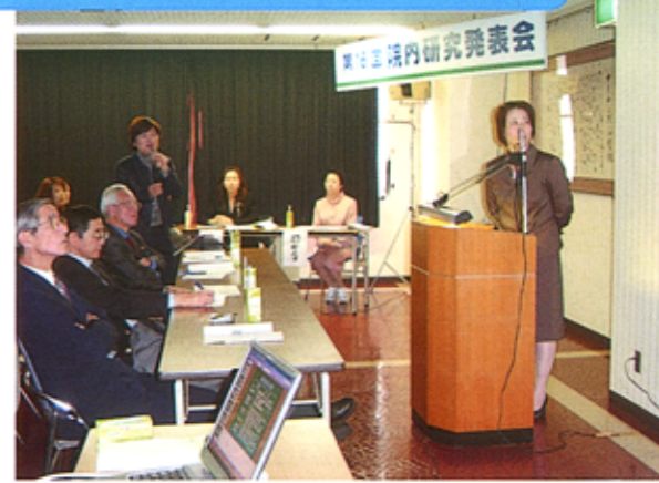
発表のあと、活発な質疑応答が行われた

スパイスは好みに合わせて、辛味が欲しい時はチリパウダー、甘味を増したいときはシナモンを加え調節します。具もチキンの代わりにシーフードや野菜を入れていろいろな味を楽しみましょう。（西能病院 栄養課）