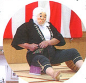
模擬店で食事を求め、親子・孫・ひ孫の四世代いっしょに食事を楽しむ風景がみられた

壁面には、文化祭をめざして製作された様々な作品が飾られました。一階では通所の方々の習字や手芸品など、二階ではバラの花の形に折った色紙をモザイクのように貼った日本地図やクラブの活動紹介・作品が目を引きました。また、三階では、作業療法で制作された毛糸や色紙の貼り絵などが展示されていました。