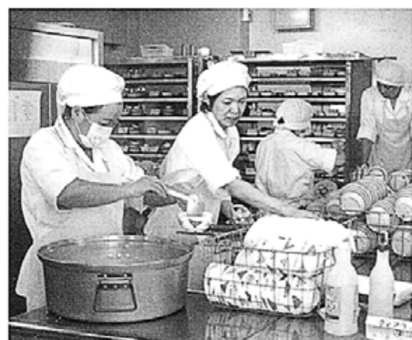
炊きたてのご飯を容器に盛り、トレイにのせて病棟へ

きれいに下処理された野菜を刻み、煮物を作り、魚を焼き、ご飯やおかゆを炊くなど、時間を見計らいながら、厨房の各所で作業が進みます。味・出来上がりの温度などを確かめて、盛り付けに入ります。カードの患者様のお名前や食事内容を一つ一つ確認しながら腕や皿を配膳車のトレイに載せま