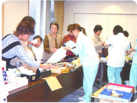
利用者のパッチワーク製品なども大好評

壁面には、文化祭をめざして製作された様々な作品が飾られました。一階では通所の方々の習字や手芸品など、二階ではバラの花の形に折った色紙をモザイクのように貼った日本地図やクラブの活動紹介・作品が目を引きました。また、三階では、作業療法で制作された毛糸や色紙の貼り絵などが展示されていました。