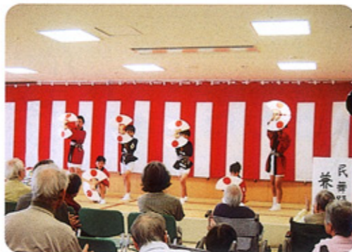
扇子、手ぬぐいなどを使って新川古代神を舞う