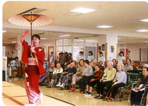
踊りにみとれて、「きれいやね」の声