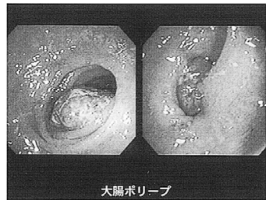
大腸ポリープにより、腸がふさがれ、便秘になっている

因となり、肝性脳症を悪化させることもある。 ●腸閉塞（イレウス）とは 腸管内容物が通過できずに腸内腔に充満し、腹痛、嘔吐、腹部膨満、排便、排ガスの停止などの症状がでる。 腸管内の腸液の貯留、嘔吐、腹水貯留などによる水分・電解質の喪失により、脱水・電解質異常を来し、循環障害・ショックとなり死に至る場合もある。 【腸閉塞の分類】 1 機械的腸閉塞（腸の器質的な病変により腸管の内腔の狭窄閉塞をおこすもの） a 閉塞性（単純性）腸閉塞 腸管の病変によるもので血管系が関与しないもの。①腸管壁の器質的な変化による狭窄閉塞、②腸管外の病変からの圧迫や牽引による狭窄閉塞（腹腔内腫瘍や手術後の腹膜炎によるもの）、③異物による内腔の狭窄閉塞（便塊、結石、回虫、誤飲した異物などによる）がある。 b 絞扼性（複雑性）腸閉塞 腸管の血行障害を伴うもので、手術が必要になる場合もある。 ①腸係蹄の絞扼による腸閉塞（先天性索状物、癒着による索状物