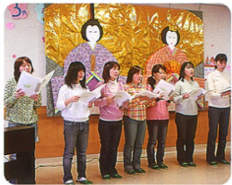
ひなまつりコンサートで歌うメンバー