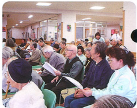
みんなで歌うと楽しいね