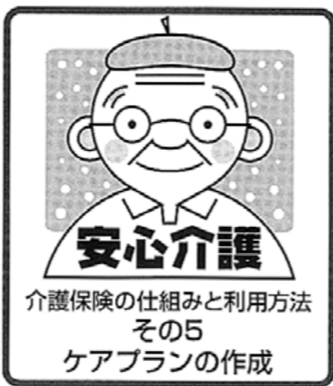
◀ケアプランの例：要介護2のAさん▶

介護認定の結果がわかったら、今度は実際に介護サービスを受けていきます。まずは、「居宅介護」か「施設サービス」かを選びます。 ●居宅サービスの場合 「ケアプラン（介護サービス計画）」を作成します。これは介護を受ける本人自身の生活をより自立したものに近づけるため、各種居宅サービスを組み合わせる計画書です。自分でも作成を依頼する方がほとんどです。介護支援専門員が作成する場合は、本人や家族の希望を聞き、その人に合ったサービスを提案し、計画書の原案を作ります。費用の計算、サービス事業者との調整も行います。本人、家族がその計画書に同意されたら、実際にサービスの利用を開始し