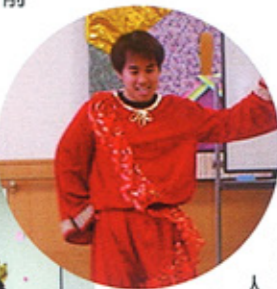
パネルシアター「いばら姫」

ラ・フォレスト・デル・カントは歌の森という意味。保育専門学校卒業生を中心に結成、メンバー約10名で、