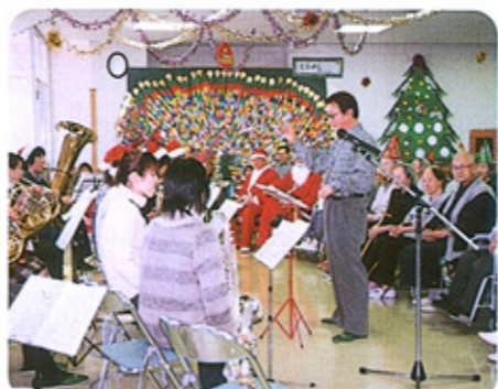
「S.O.B」の軽快な演奏に聴き入る利用者