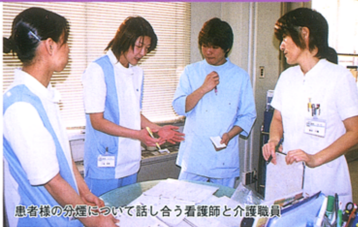
患者様の分煙について話し合う看護師と介護職員