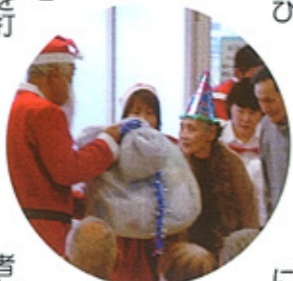
者から喜ばれていた。

十二月十七日午後、年の瀬のひととき、「S.O.B」のメンバー二十六名がみどり苑を訪れ、音楽をプレゼントした。童謡や日本民謡メドレーに加え、美空ひばりオンパレード演奏、りんご追分や柔などの曲に合わせて懐かしそうに歌って、手拍子で打つ入所者の姿が見られた。