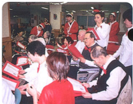
赤い蝶ネクタイのみどり苑合唱団