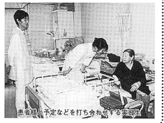
患者様と予定などを打ち合わせする実習生

12月1日から2週間、当院で医師会看 護専門学校看護学科の学生9名が援助 技術や診療補助技術を習得、患者様の基 本的欲求に応える看護実習を行いました。 医療現場で初めて患者様に接し、ベッ ド周辺の環境整備やオムツ替え、清拭な どを通して、医療業務の大切さや介護業 務の必要性を身をもって学びました。