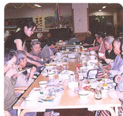
デザートケーキに舌鼓!

クリスマスディナー 夜は、クリスマスを祝う夕食会。ろうそくが灯るなか、シャンパンで