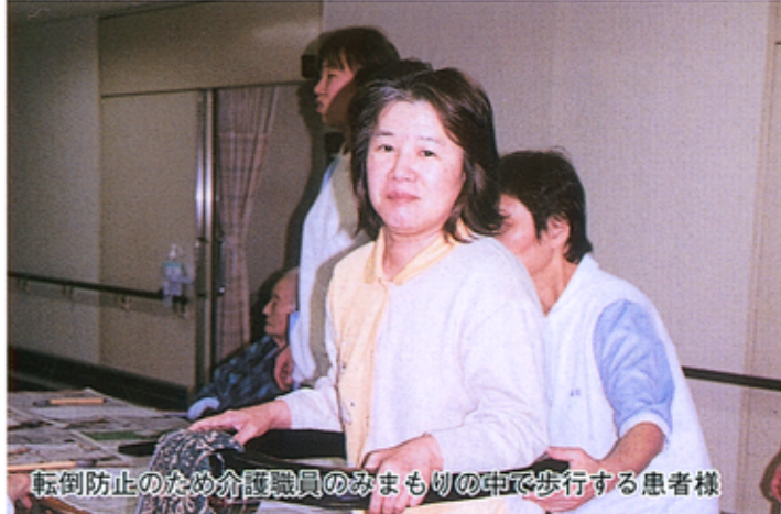
転倒防止のため介護職員のみまもりの中で歩行する患者様