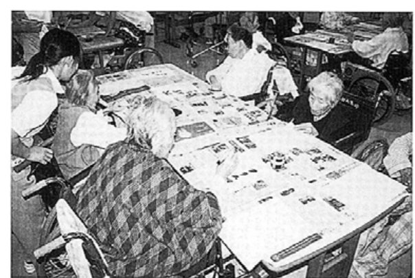
左手や動きにくい右手で習字をする患者様 「昔のように筆がうまく動かないね」

療養型病棟では、生活リズム を持って療養を進めるために、 患者様は可能な限りベッドを 離れて活動します。モーニング ケア後食事をとり、九時過ぎか らお昼まで、デイルームでテレ ビを見たり体操やゲーム楽しみ、 この間にリハビリや入浴をしま す。 毎週水曜日午後にはさまざま