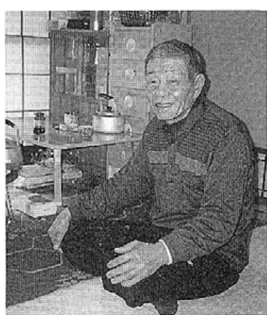
「足腰にあまり負担をかけないよう う気をつけています」(自宅にて)

西能病院は、昭和六十二年四月から休業日診療を行っております。正月は元旦だけ休みますが、二日から診療いたします