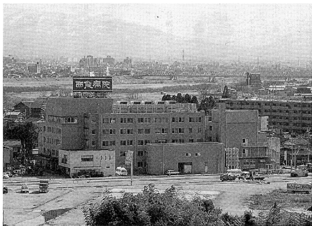
地域と共に36年の「ねんりん」を刻んだ西能病院

一 至誠は情をかりしか 一言行に恥づるなりしか 一 氣力に盡るなりしか 一 努力に憾みなりしか 一 不精に負るなりしか