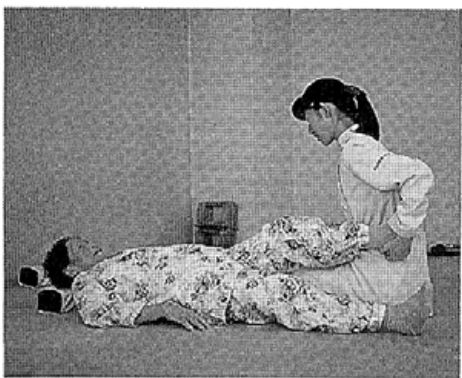
実習する前島さん

岐阜市の平成医療専門学院理学療法学科二年(小矢部市出身)は二月二日から三月六日まで、リハビリテーションで実習をうけた。以下はその感想文である。 「あっといふ間の五週間でした。ようやく患者さまとも楽しくお話 患者さまと接し、お話を聞いていくうちに、障害に対するさまざまな思いに触れ、今思えば、そんな患者さまの姿に励まされながらの実習だったように思います。 最後に、ご迷惑をかけ通じたにもかかわらず、時間をさいて御指導くださった先生方、そして患者さま、お世話になりました。本当に、ありがとうございました。