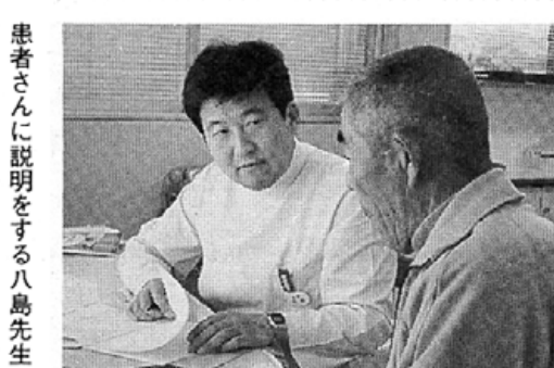
八島先生は新澤出身、三十四歳の青年医師。母校・富山医科大学から派遣して昨年春から勤務している。