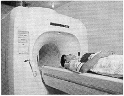
画像センターでMRI検査