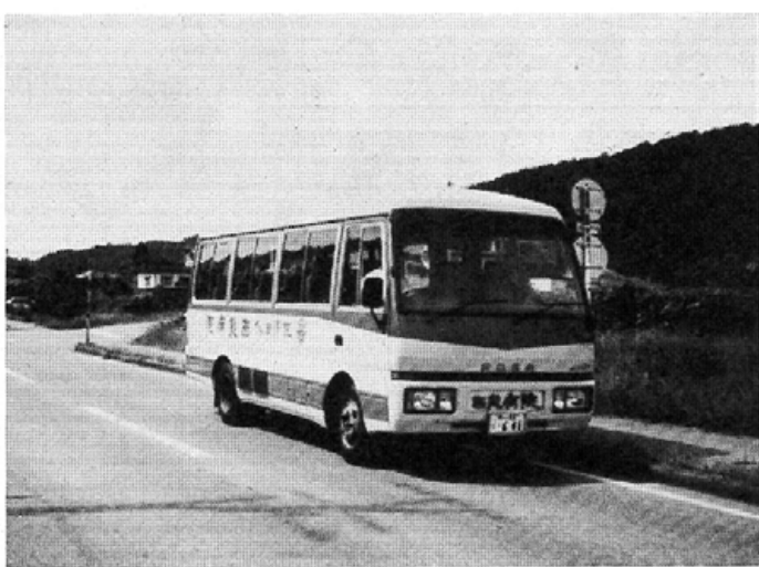
富山市金屋地内を走る通院バス

昨年十二月十日から神通川以西の二つの新コースで、午前中それぞれ二便の通院バス（日曜日、祝日は休み）を運行してから十ヵ月。利用する患者さんたちが次第にふえてきて、「もうなじんだね、病院がうんと近くなった」と喜んでいて、病院では、まだバスの運行を知らなかったり、運行時間がわからず不便を感じている人たちがいるとみて、運行経路の要所要所に運行時刻表を掲示、運行地域に領布して、さらに遠慮をはかることにしている。