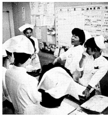
川西婦長を囲んで朝のミーティング