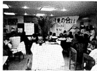
十三日県体育課主催のスポーツ指導者研修会

月見ダンゴを： 十二日三階デイルームで入院患者さんの月見の会。ススキと供え物をまん中にして、歌をうたったり、月見ダンゴを賞味して楽しいひと時をすごした。(写真右下)