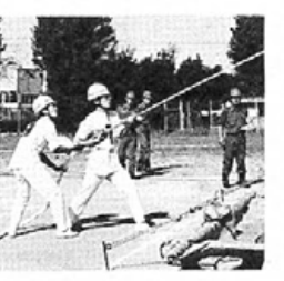
内の屋内消火栓操法大会は牛島公園で開かれ、病院から男女各一チーム(一チーム三人)が出場。(写真右)