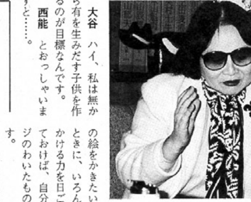
「人との出会いがありまして、その何年かあとで...」と大谷さん（左）「運がころがってきても、それを消化するだけの力が...」と西能理事長（右）