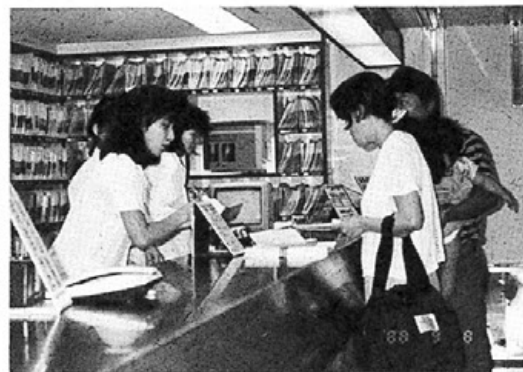
外来患者さんの窓口である受け付け風景

八月に入り新しい仲間(女性四人)が加わり、総勢十人という医事課は、これまで以上に大世帯になった。狭い事務室では人の行き交いにも気を遣うほどになり、この夏は人の熱気とコンピュータの音が出すファンの熱気も加わった。 八月に入ると、新しい仲間(女性四人)が加わり、総勢十人という医事課は、これまで以上に大世帯になった。狭い事務室では人の行き交いにも気を遣うほどになり、この夏は人の熱気とコンピュータの音が出すファンの熱気も加わった。