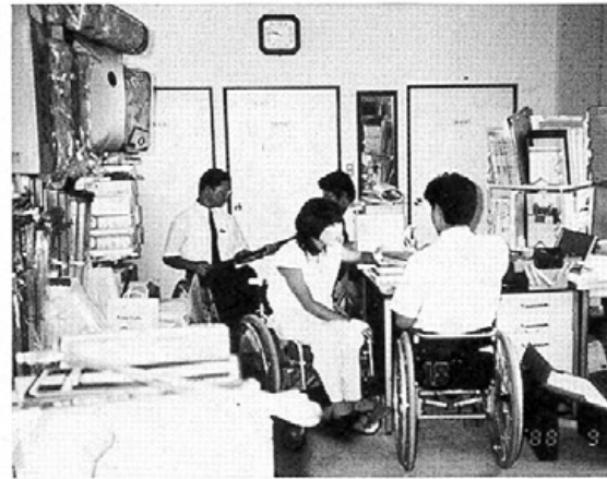
事務所で仕事の打ち合わせや部品の修理をする仲間たち

車椅子(四人)軽度障害(一人)の仲間たち五人が、パートの女性二人を加え、総勢七人で株式会社「ウイル」を発足させたのは昨年十月一日。おむつカバーから車椅子まで身障者や老人の介護用品の総合販売。身障、老人用の住宅も手がけている。業績は除々に伸びており、「きめ細かいサービス」と大ハッキリ。今日も車椅子が県下の病院や老人ホームを駆け回る。