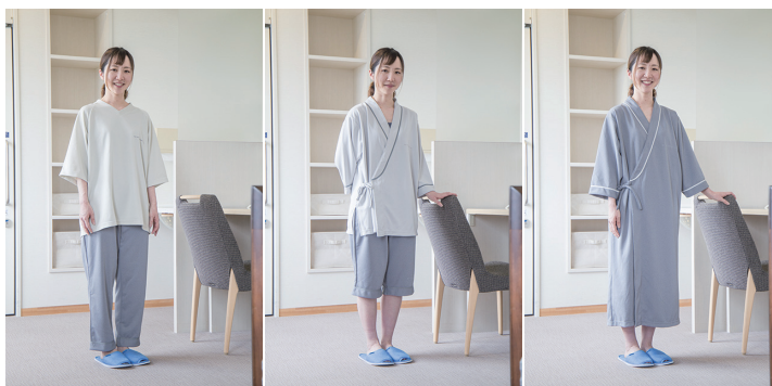
トレーナータイプ 甚平タイプ ガウンタイプ