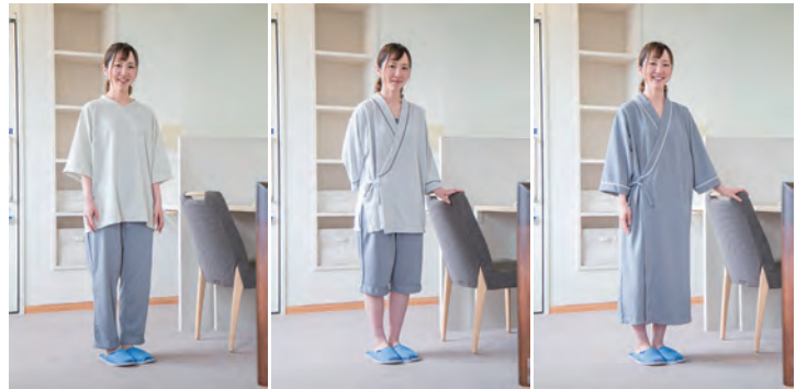
トレーナータイプ 甚平タイプ ガウンタイプ